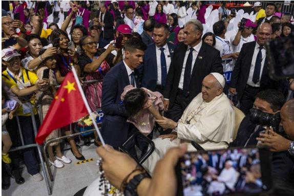
Paus Franciscus wordt bij aankomst in het ijshockeystadion voor de eucharistie ook door enkele Chinese katholieken verwelkomd.

Op de heenweg naar Mongolië had Franciscus zoals gebruikelijk een telegram gestuurd naar president Xi Jinping toen hij over Chinees grondgebied vloog. Een woordvoerder van de Chinese overheid noemde dat vrijdag 'een teken van vriendschap en goede wil'. Volgens de woordvoerder wil China 'de constructieve dialoog met het Vaticaan verder voeren, het begrip doen toenemen, het wederzijdse vertrouwen opbouwen en een proces van verbetering van de betrekkingen tussen beide zijden op gang brengen'.